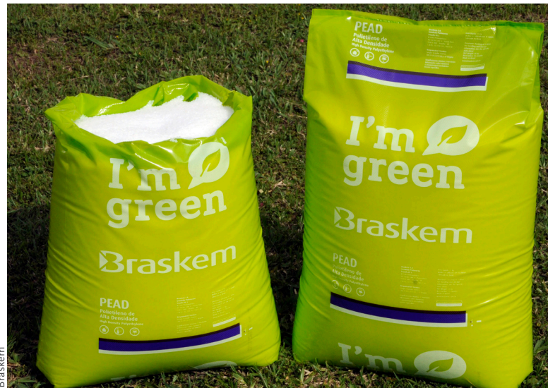
Biobasiertes PE aus Zuckerrohr.

Biobasierte technische Kunststoffe bilden eine große Gruppe mit vielen speziellen Polymeren. Darunter sind biobasierte Polyamide (PA), Polyester (z.B. PTT, PBT), Polyurethane (PUR) und Polyepoxide, die ganz unterschiedlich genutzt werden können. Typische technische Anwendungen sind textile Fasern (Sitzbezüge, Teppiche), Schaumstoffe für Sitze, Gehäuseteile, Leitungen, Schläuche, konstruktive Elemente, Überzüge etc. Im Regelfall liegt die Gebrauchsdauer bei mehreren Jahren, so dass man von "langlebigen" Kunststoffen (engl. durables) spricht. Biologische Abbaubarkeit ist hier unerwünscht.